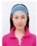
幅の広いヘアバンド等により顔部が隠れているもの