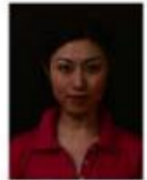
背景の色が濃く人物を特定できないもの