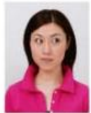
視線が正面でないもの