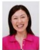
平常の顔貌と著しく異なるもの