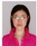
照明が眼鏡に反射したもの