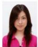
前髪が目元にかかっているもの