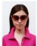
サングラスをかけているもの