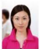
人物が写り込んでいるもの