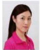
顔が横向きのもの