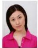
顔が左右に傾いているもの