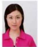
顔が左右に寄っているもの