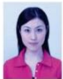
著しく変色しているもの