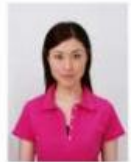
上三分身より小さいもの