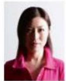
顔に影があるもの