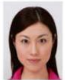
上三分身より大きいもの

×不適当な写真例（不適当な写真であった場合は、再度提出をお願いする場合があります。）