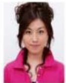
上部余白がないもの